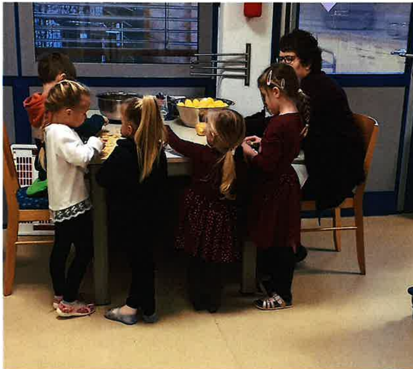
Unsere Helferlein in der Küche beim Kartoffeln schälen

Für die Ganztagskinder gibt es ab 14.30 Uhr noch einen kleinen Imbiss, den sie wie das Frühstück von zuhause mitbringen. Jetzt sind gesüßte Sachen erlaubt, viele Kinder haben Joghurt oder ähnliches dabei.