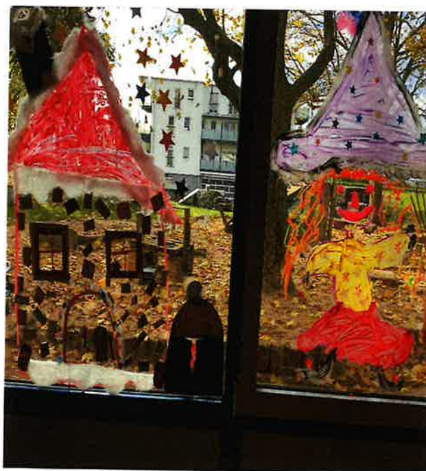
Fensterdekoration im Atelier